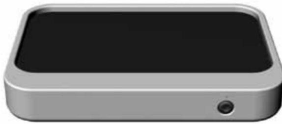
Appareil 1 zone GN 1/1