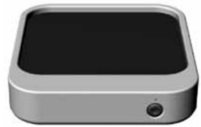
Appareil 1 zone GN 2/3