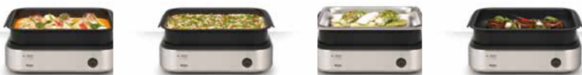
REGENERER ET CUIRE.

Les plats préparés peuvent être cuits automatiquement à point avec les programmes P1 à P6. Les 3 niveaux de maintien au chaud garantissent un apport de chaleur constant pour garder les plats à température en douceur et assurer une qualité parfaite dans la durée. Les niveaux de puissance 4 à 6 permettent au chef de rôtir, griller, cuire et cuire à la vapeur. Le K-POT est disponible aux formats GN 1/1 et GN 2/3.